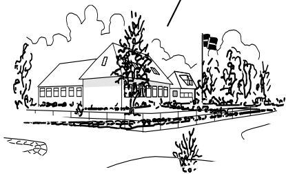
Eckersberg Friskole og Støtteforeningen